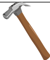
de hamer Nummer 6