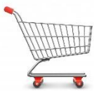
het boodschappen-wagentje Nummer 3

9- het is gemaakt van metaal en plastic. - het is groot. - het houdt je eten en drinken koud. - je vindt dit ding in de keuken.