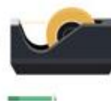
het plakband Nummer 5