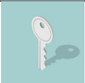
de sleutel Nummer 7